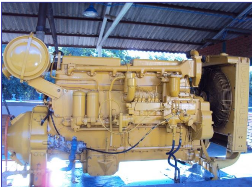
Motor CATERPILLAR D342 TOP END - Cabezas P.

SERVICIO TORNERIA POLIDUCTOS OVH 2025 – 2026