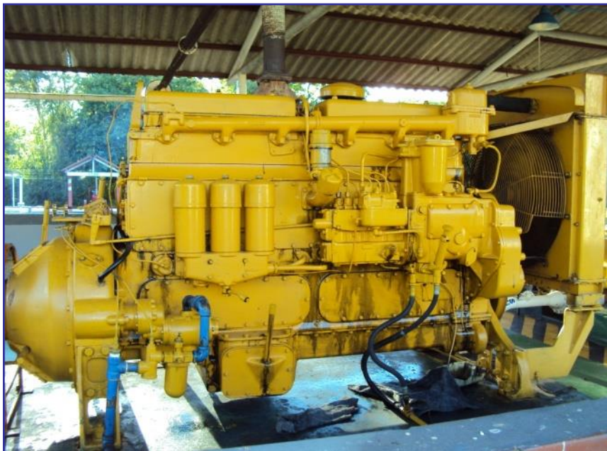
Motor CATERPILLAR D342 UBP02 MPP5 - Cabezas P.