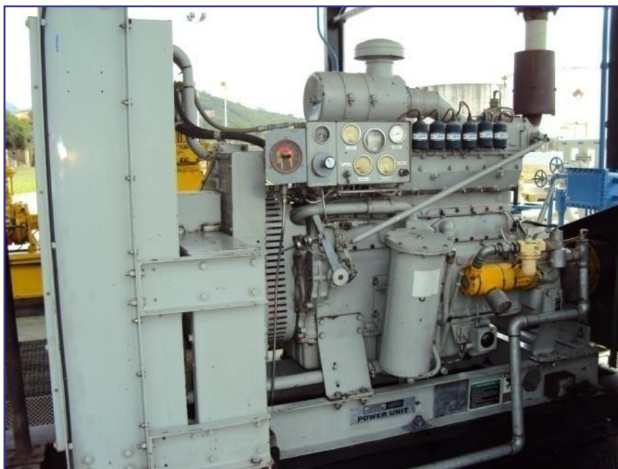
Motor WAUKESHA F11 SGI MPP5 - Chorety P.